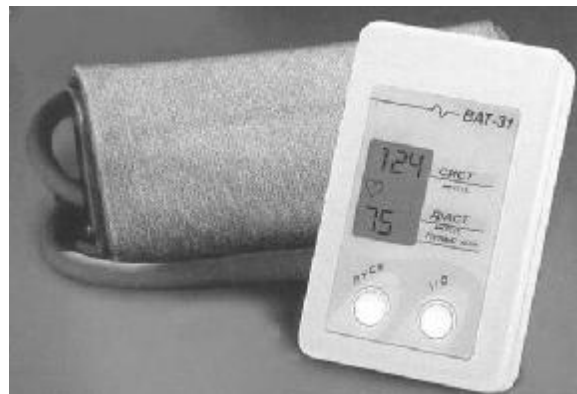
Рис. 1. Внешний вид тонометра

Конструктивно тонометр выполнен в виде электронного блока в пластиковом корпусе размерами 122×76×48 мм и внешней эластичной плечевой манжете, надеваемой на плечо пациента (выше локтевого сустава) и подсоединяемой к электронному блоку при помощи гибкого шланга. Внешний вид тонометра показан на рис. 1, а его электронный блок — на рис. 2.