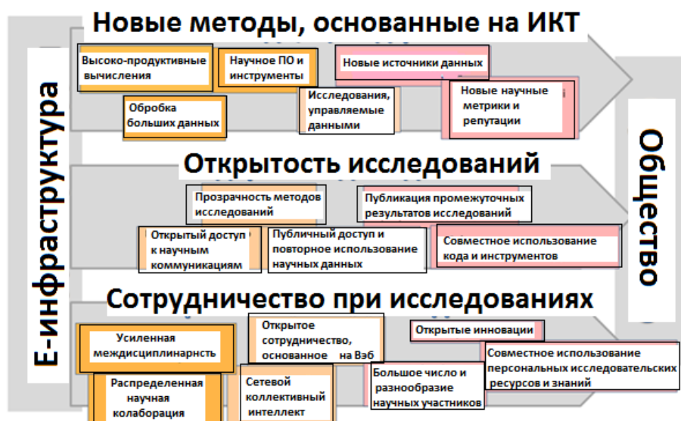
Рис.3. Средства цифровой науки [31]

Кроме того, научное сотрудничество развивается в сторону крупномасштабных проектов, которые поддерживают открытое участие любых заинтересованных субъектов, формирование коллективного разума групп, состоящих из как профессиональных, так и любительских исследователей. Открытость исследовательских процессов позволяет динамически расширять сотрудничество при решении конкретных научных задач и объединять онлайн-сообщества научных работников также за пределами конкретных исследовательских задач.